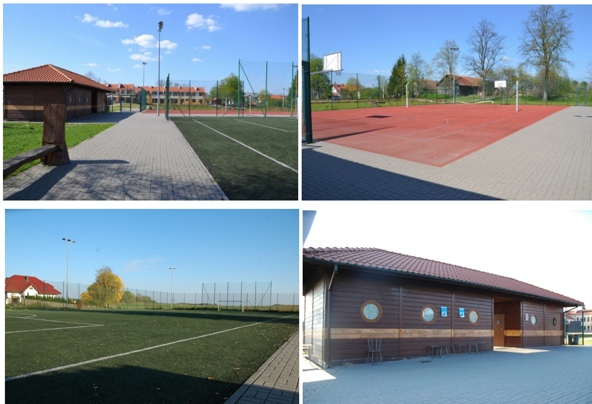
Fot. Kompleks Boisk Orlik

Zostały wykonane przyłącza wodno-kanalizacyjne i do sieci elektro - energetycznej a pod boiskami zainstalowano odwodnienie (drenaż). Boiska zostały ogrodzone ogrodzeniem z siatki stalowej powlekanej a boisko piłkarskie wyposażono w piłkochwyty. Zbudowano dojścia i dojazdy do obiektów. Lokalizacja kompleksu zapewnia bezpieczny i łatwy dojazd do obiektu (dzieci i młodzież mogą bez opieki dorosłych dojechać lub dojść do obiektu), oraz szybką i tanią realizację inwestycji. Z kompleksu chętnie korzystają turyści zatrzymujący się w okolicznych ośrodkach wypoczynkowych i gospodarstwach agroturystycznych a przede wszystkim dzieci i młodzież pod opieką wykwalifikowanego Animatora. Dzięki współpracy Gminy z Gminnym Klubem Sportowym Gietrzwałd - Unieszewo na Orliku w Sząbruku są organizowane przeróżne imprezy sportowe i odbywają się regularne treningi piłkarskich grup młodzieżowych, zarówno chłopców jak i dziewcząt. Orliki, Żacy i Trampkarze mają za sobą pierwsze sukcesy.