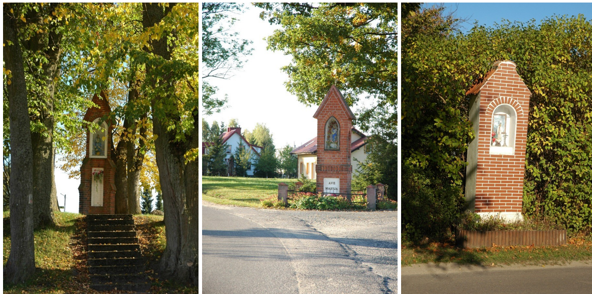
Fot. Kapliczki przydrożne

Kolejnym zabytkiem Sząbruka są kapliczki, z których część powstała zgodnie z dawną tradycją przy drogach i szosach. Na terenie Sząbruka znajduje się 7 kapliczek, a 3 z nich wpisane są do rejestru zabytków (A-2881, A-2883, A-4193). W Sząbruku były też kapliczki zbudowane przez mieszkańców, najczęściej przy swoich domach, posesjach, zagrodach. Były to kapliczki błagalne dziękczynne i przebłagalne. Do dnia dzisiejszego zatrzymują one pielgrzymów na wspólną modlitwę i śpiewy, a według dawnych wierzeń odpędzały złe duchy, które gromadziły się w tych miejscach. Sząbruckie figurki we wnękach kapliczek przedstawiają przede wszystkim wizerunek Matki Boskiej. Budowanie kapliczek wiąże się z Kultem Maryjnym na Warmii, który po objawieniach gietrzwałdzkich (1877r.) umocnił się. Objawienia te były początkiem odbywających się licznych pielgrzymek do Sanktuarium Maryjnego w Gietrzwałdzie. Kapliczki są wyraźnym dowodem na głęboką wiarę i pobożność mieszkańców Sząbruka.