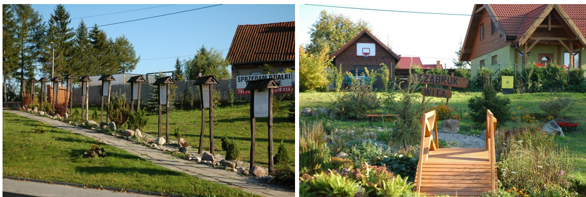
Fot. Plac w centrum wsi