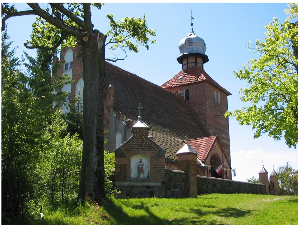
Fot. Kościół Parafialny p.w. św. Mikołaja i św. Jana Ewangelisty w Sząbruku

Jednym z ważniejszych obiektów znajdujących się w Sząbruku jest Kościół Parafialny, który jest wpisany do rejestru zabytków.