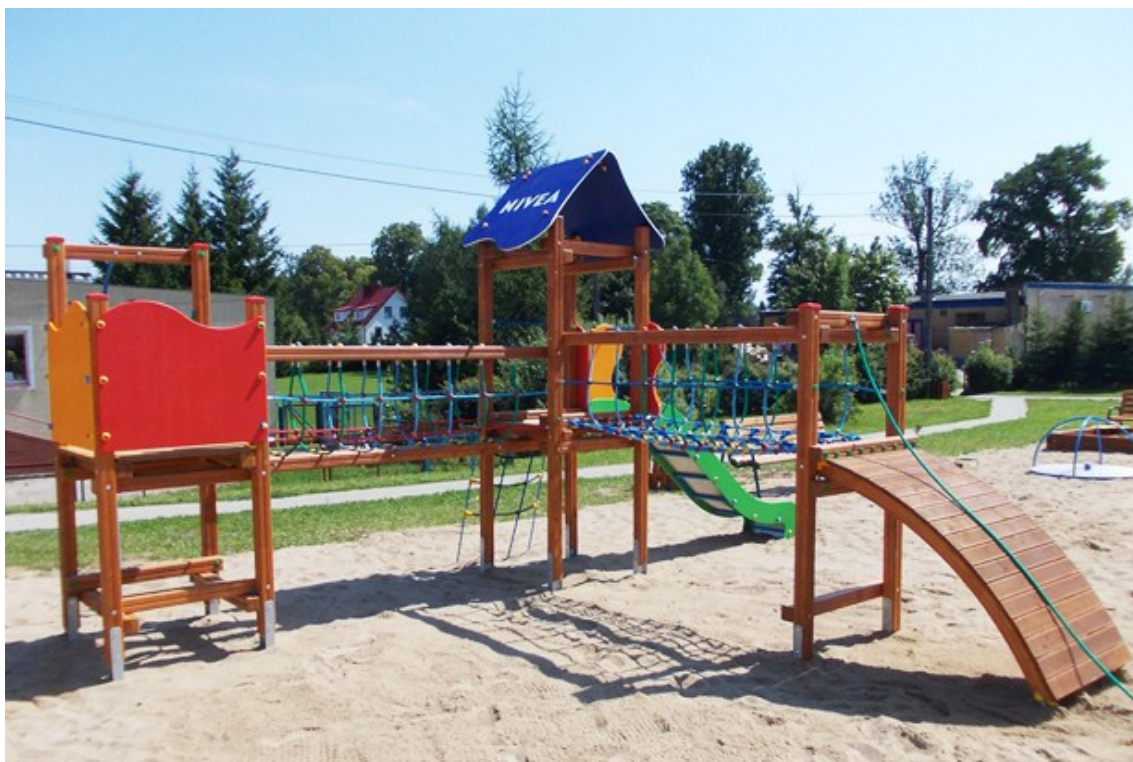
Fot. Plac zabaw NIVEA

karuzela, bujak, huśtawka, ławki, kosz na śmieci i tablica informacyjna. Teren został ogrodzony.